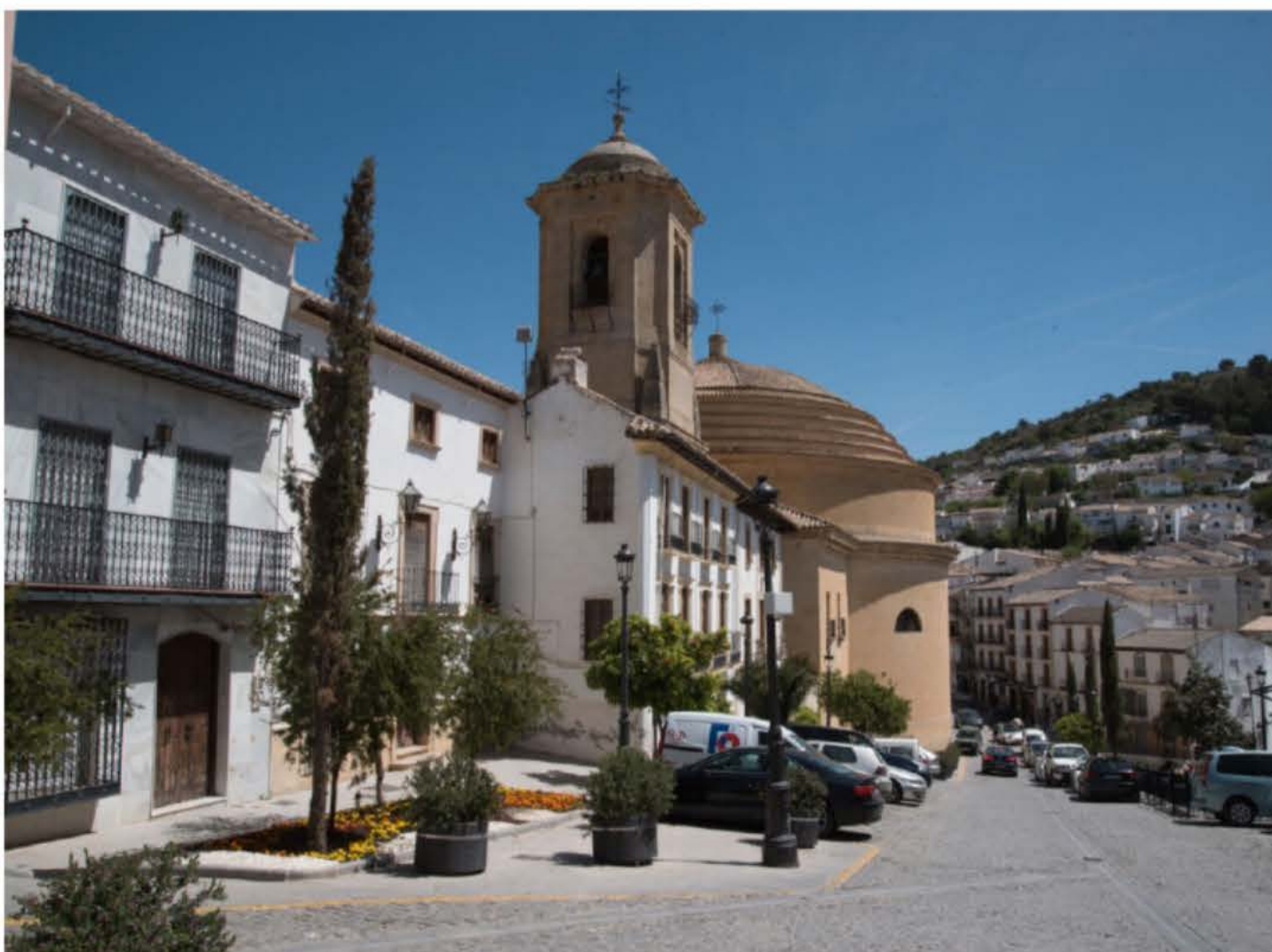
Den sirkelrunde kirken i Montefrio, Iglesia de la Encarnacion, har en diameter på 30 meter. Og samme arkitekt som Pantheon i Roma.