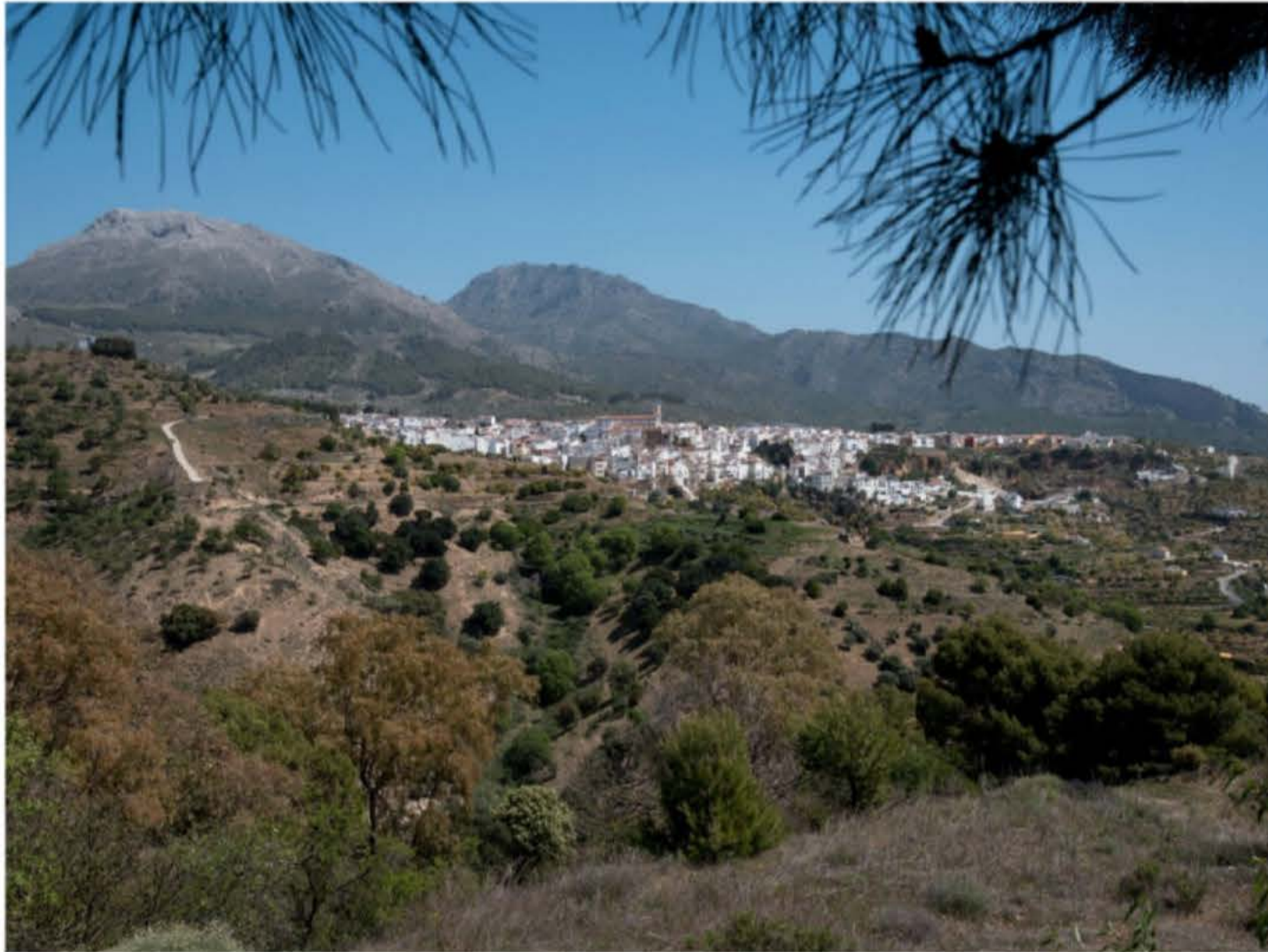
Yunquera ligger tett på nasjonalparken, turstier, flora og fauna.